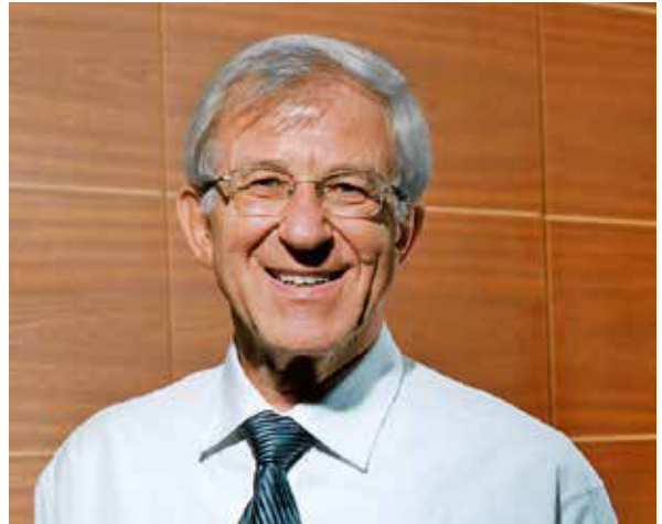
Dr. Franz Alt Der Solaraktivist, Fernsehjournalist und Bestsellerautor setzt sich seit Jahrzehnten für eine nationale und globale Energiewende ein.

in den nächsten 25 Jahren zu 100 Prozent auf erneuerbare Energien umzusteigen, das können wir schaffen. Voraussetzung dafür ist freilich, dass wir nicht länger gegen die Natur, sondern mit der Natur wirtschaften. Wir haben alle Energieträger, die wir brauchen, direkt vor der Haustür: Sonne, Wind, Wasserkraft, Erdwärme und Bioenergie vom Acker und vom Wald. Allein die Sonne schickt uns jeden Tag (!) 15.000-mal mehr Energie als die Menschheit braucht. Eine ökologische Energieversorgung mit ökonomischen Vorteilen wird Jahr um Jahr attraktiver.